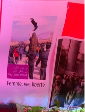
Femme, vie, liberté